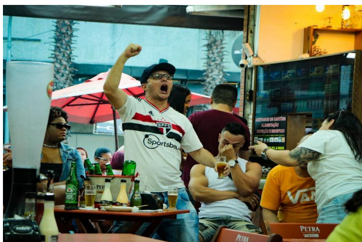
Fotografia 2 – Por: Isabel Andrade

preferir ir nas sedes das torcidas em busca ter as cores marcantes como um elemento essencial. Mesmo com todas as dificuldades de iluminação e ângulos as fotos aproveitadas estavam do meu agrado.