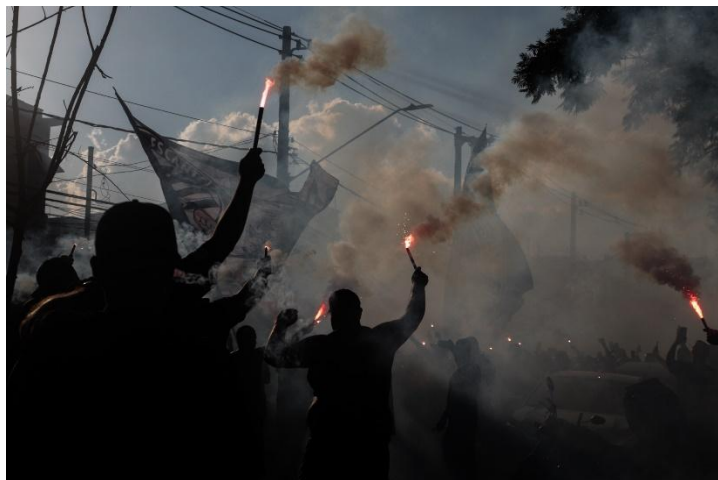
Fotografia 4

O dia estava perfeito para fotografias: céu limpo, boa luz natural e muita movimentação na rua, garantindo registros fotográficos nítidos e de grandes qualidades. Todas as fotos foram feitas com segurança e dentro do planejamento, permitindo registrar tanto planos abertos quanto de detalhes mais fechados. (Fotografia 4)