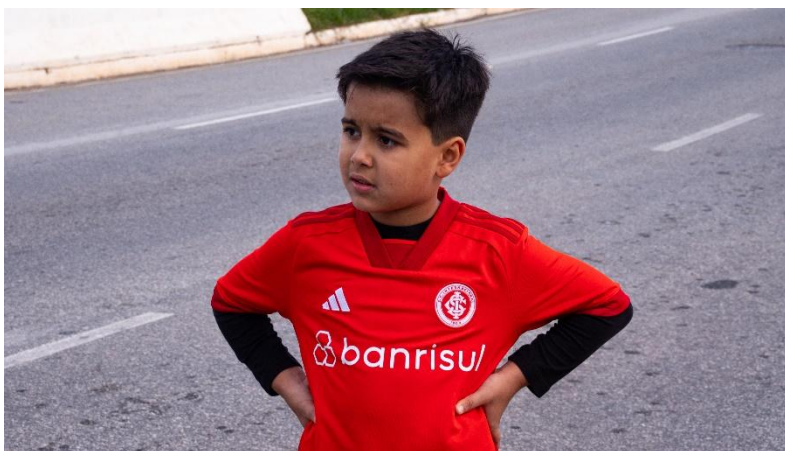
Fotografia 8

Diante dos acontecimentos, o resultado das fotos não me agradou por completo. Além das limitações impostas pela ocasião, o emocional também pesou. Como futura profissional da área, amante do futebol e torcedora, sai abalada e frustrada. Viver o que todos dizem é uma tristeza profunda, por conta de minorias todos são penalizados, inclusive aqueles que estão ali apenas para torcer, viver e registrar momentos únicos e calorosos.