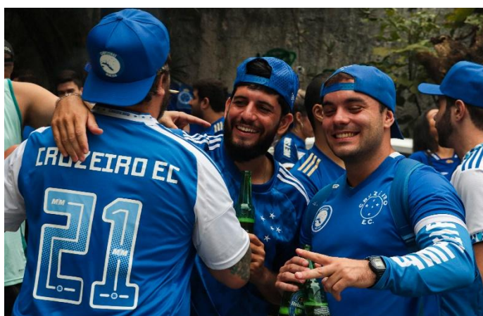
Fotografia 6

O resultado final me agradou bastante. Apesar de estar em um ambiente já conhecido, a presença de pessoas diferentes e o foco específico na torcida visitante trouxeram uma nova perspectiva de espaço. Além das boas imagens, a experiência também me permitiu conhecer novos