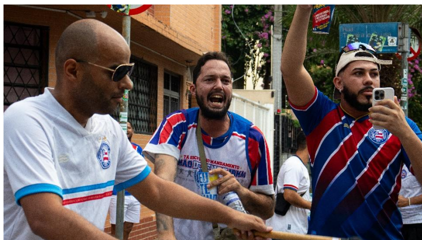
Fotografia 7 – Por: Isabel Andrade