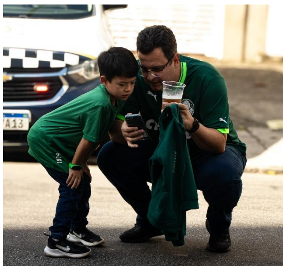
Fotografia 10

Para não perder viagem, mais uma vez, fotografei a torcida alviverde lá presente, festejando e com grandes expectativas de vitória. As técnicas utilizadas foram as mesmas, a busca pelo padrão é o que me deixa mais satisfeita com todos os registros. (Fotografia 10)