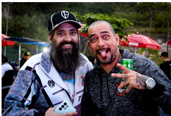
Fotografia 3

condições de baixa iluminação. A ausência da luz do dia e a falta de postes de iluminação exigiram maior sensibilidade técnica, principalmente na regulagem do ISO. (Fotografia 3)