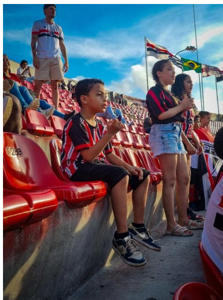
Fotografia 5

As fotos foram realizadas com o meu próprio celular, o que naturalmente limitou alguns ângulos e possibilidades de composição. Apesar disso, consegui extrair bons registros, a identidade visual fez toda a diferença, destacando as cores do clube. A iluminação foi extremamente favorável, garantindo nitidez e grandes qualidades. (Fotografia 5